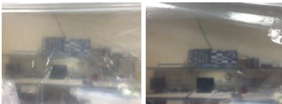
Rouška se skvrnami/voskovým vzhledem