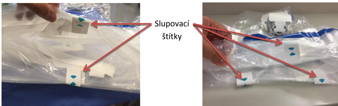
Rouška nástrojového ramene