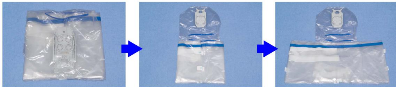
Obrázek 1. – Příklad: rouška na rameno nástroje